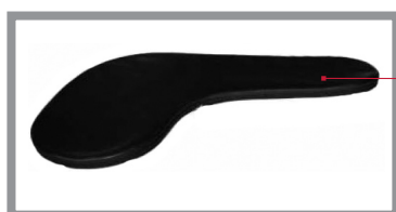
Figure 2 – Vue de dessous