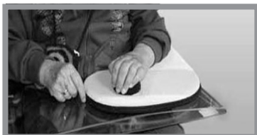
Figure 4 – Positionnement du bras

N'effectuez aucun mouvement brutal pour positionner le bras atteint sur l'accessoire. Un positionnement brutal pourrait provoquer des lésions des muscles, des tendons et des ligaments atteints. En cas de douleurs, ne positionnez pas votre bras atteint sur l'accessoire, car les mouvements douloureux favorisent l'apparition de spasmes.