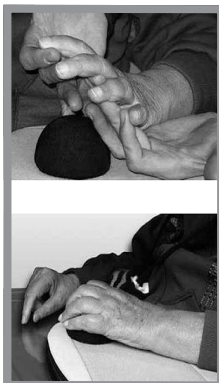
Figure 5 – Positionnement de la main

N'effectuez jamais de mouvements brutaux pour positionner votre main atteinte. Ne forcez pas sur vos doigts pour les ouvrir. Un positionnement brutal pourrait provoquer des lésions des muscles, des tendons et des ligaments atteints.