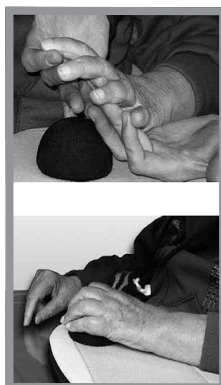
Figura 5 – Posizionamento della mano

Procedere con cautela al posizionamento della mano interessata, vale a dire non piegare con forza le dita. Un posizionamento violento può causare una lesione ai muscoli, tendini e legamenti interessati.