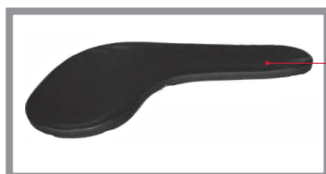
Abbildung 2 – Rückansicht