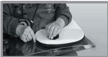
Abbildung 4 – Armlagerung

Nehmen Sie die Lagerung des betroffenen Arms nicht gewaltsam vor. Eine gewaltsame Lagerung kann zu Verletzungen der betroffenen Muskeln, Sehnen und Bänder führen. Lagern Sie Ihren betroffenen Arm nicht bei bestehenden Schmerzen, da die Bewegungen unter Schmerzen sich spastikfördernd auswirken können.