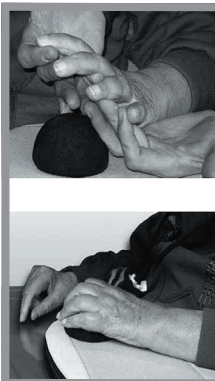
Abbildung 5 – Auflegen der Hand

Nehmen Sie die Lagerung der betroffenen Hand nicht gewaltsam vor, d.h. biegen Sie die Finger nicht gewaltsam auf. Eine gewaltsame Lagerung kann zu Verletzungen der betreffenden Muskeln, Sehnen und Bänder führen.